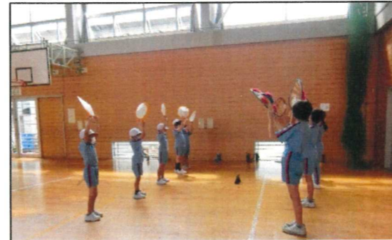
5年生がお手本を見せてくれました。

5年生との活動となると学級で踊った時と様子が違い、最初は子ども達も緊張した面もちでした。しかし、次第に表情も和らいで楽しんで踊っている様子が伝わってきました。この日のために5年生は踊りを復習して、どのようにしたら2年生にうまく教えられるのかを考えてくれました。花笠も5年生が一人一人に作ってくれたものを使っています。このような活動を通して、上級生が自分たちのために活動してくれていることを2年生の子ども達は感じ取り、自分たちも下級生にどのように接していけば良いのかを経験から学んでいます。